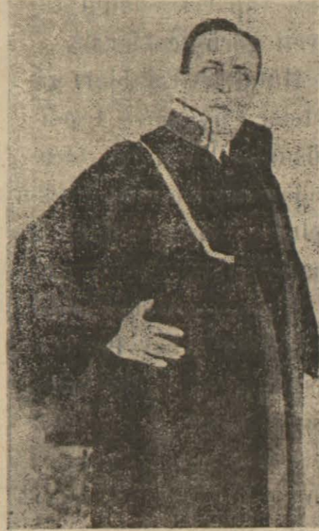
Cumhuriyet Müddeiumumisi Bay Şeref Eroğlu

Cumhuriyet Adliyesinin yüksek kararıyle yazılarımızın samimi tenkidten ibaret olduğu bir daha anlaşıldı.